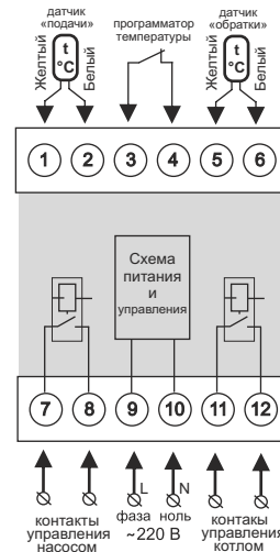
Схема 1. Упрощенная внутренняя схема и схема подключения

Датчик температуры «обратки» синего цвета подключается к клеммам 5 и 6, причем желтый провод к клемме 5, а белый к клемме 6.